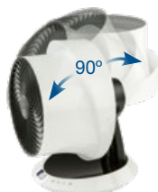
nastavitelná poloha ventilátoru