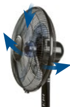
pohyblivá hlava ventilátoru