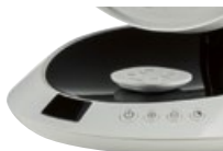
dotykový panel s dálkovým ovladačem