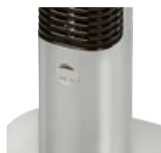
místo pro osvěžovač