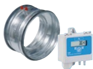
MR měřicí kruh (K. 7.2) s TDP-D pro měření průtoku (K 8.2)